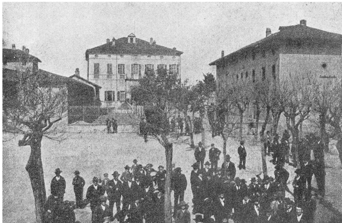
Foto 1 – Epoca, seconda metà '800 – Facciate lato sud-est e sud-ovest.

La seguente documentazione fotografica rappresenta l'edificio oggetto di intervento in epoche precedenti e ne documenta, almeno in parte, l'evoluzione a seguito dei vari interventi cui è stato sottoposto.