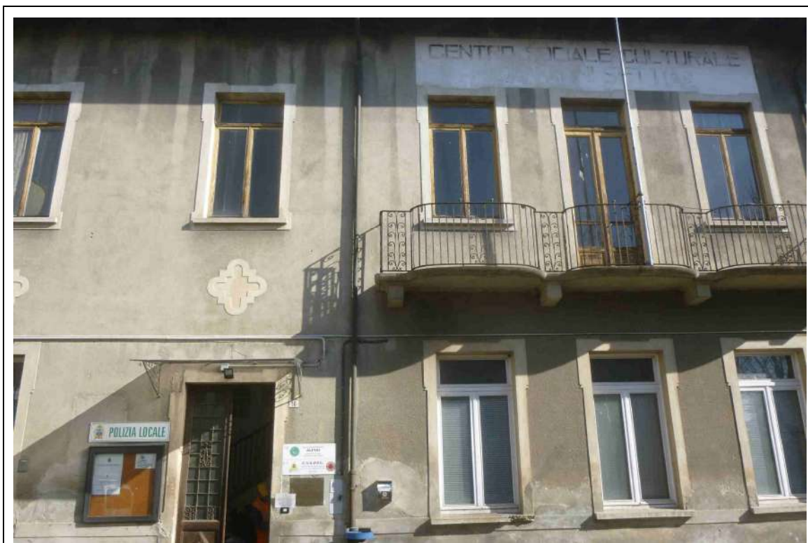
Foto 5 – Stato di fatto – Dettaglio facciata lato sud (Serramenti)