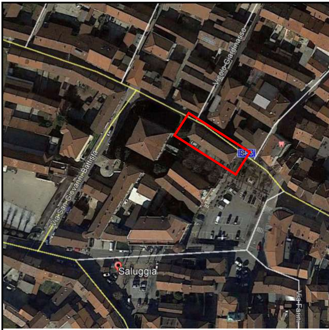
Immagine 1 – Ortofoto, fuori scala.

Il sito oggetto di intervento è censito al Nuovo Catasto Edilizio Urbano del comune di Saluggia (VC) al foglio 15, particella 19, sub. nn. 1, 2 e 3 e al Catasto Terreni al F. 15, particella n. 19.