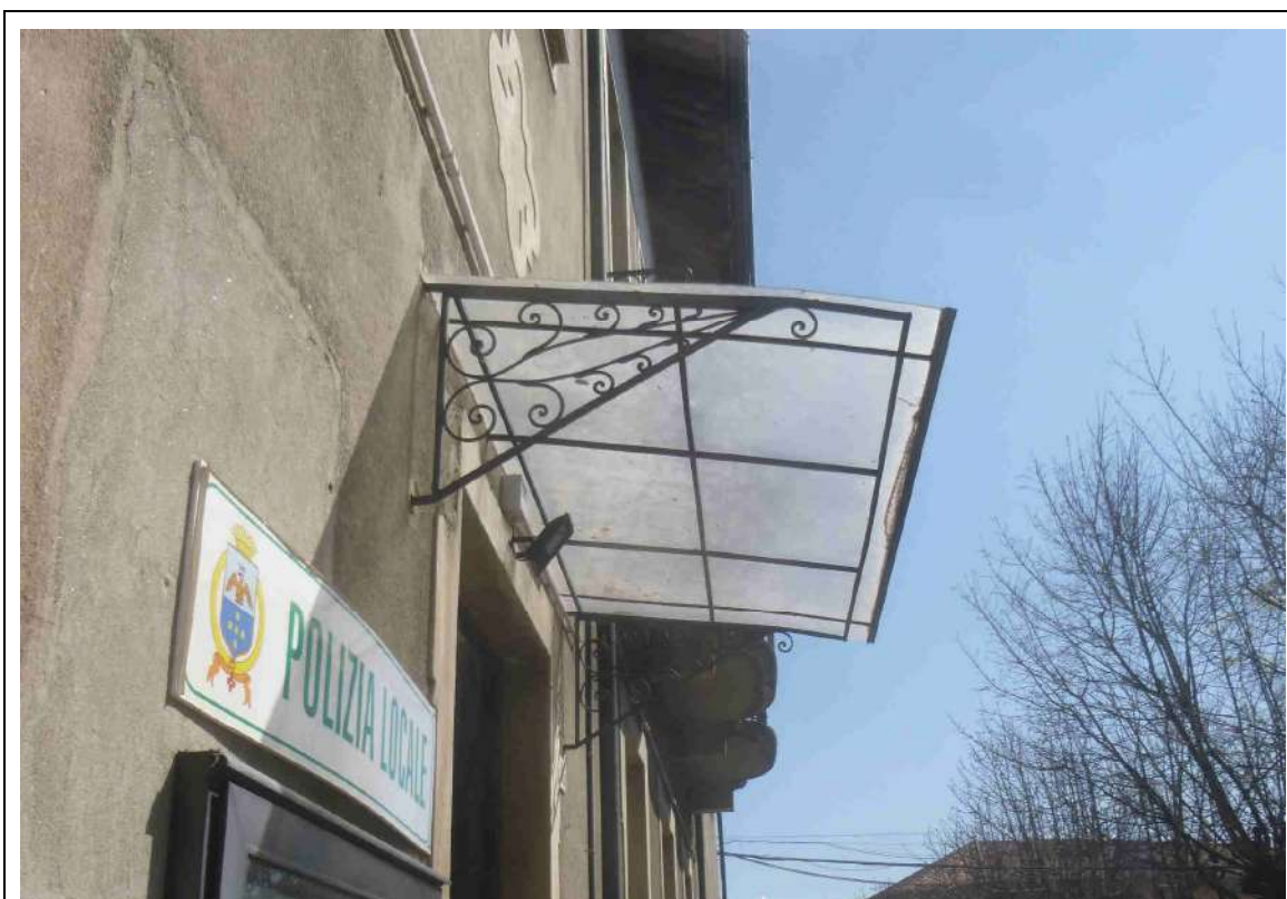
Foto 22 – Stato di fatto – Dettaglio elemento decorativo pensilina da recuperare