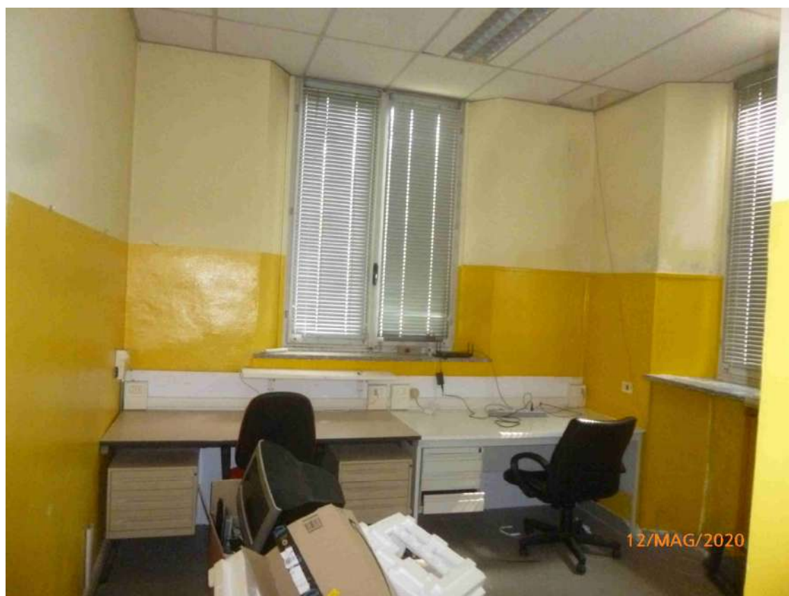
Foto 8 – Stato di fatto – Dettaglio interno serramento a piano terra