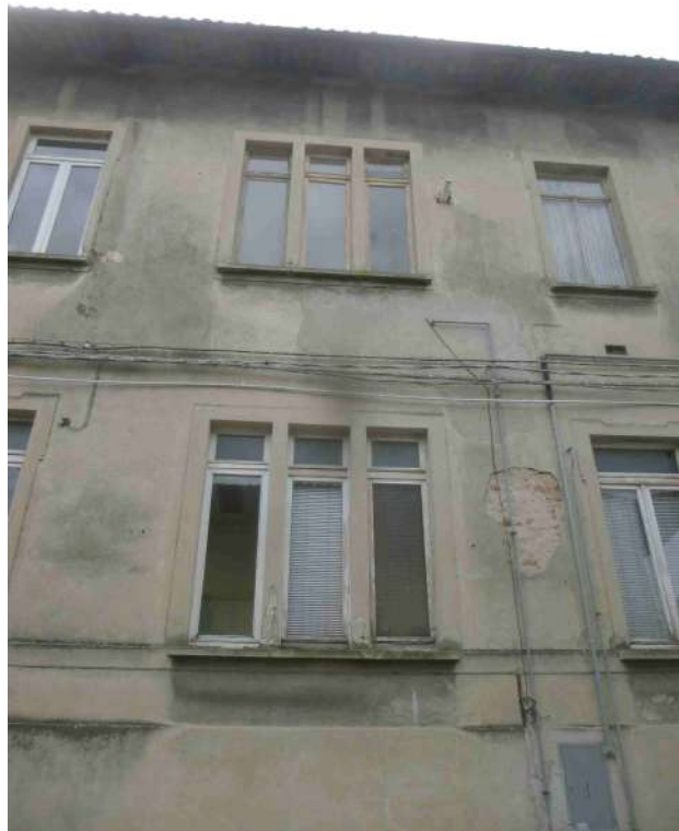
Foto 17 – Stato di fatto – Dettaglio facciata su via Don F. Cerruti