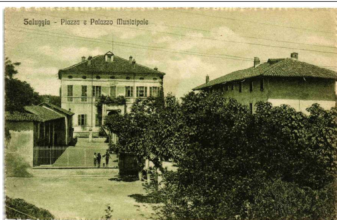
Foto 2 – Epoca, seconda metà '800 – Facciate lato sud-est e sud-ovest.