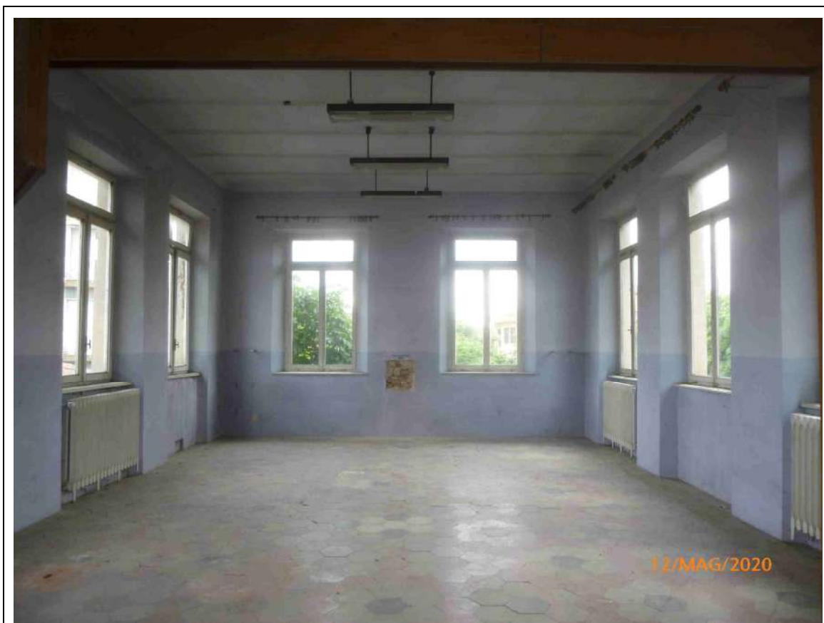
Foto 9 – Stato di fatto – Dettaglio interno serramenti a piano primo