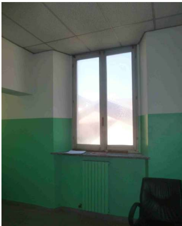
Foto 7 – Stato di fatto – Dettaglio interno serramento a piano terra