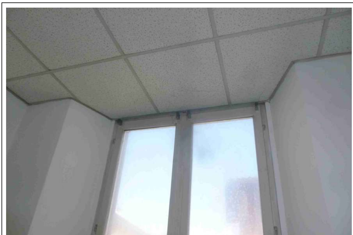
Foto 12 – Stato di fatto – Dettaglio controsoffitto su serramenti a piano terra