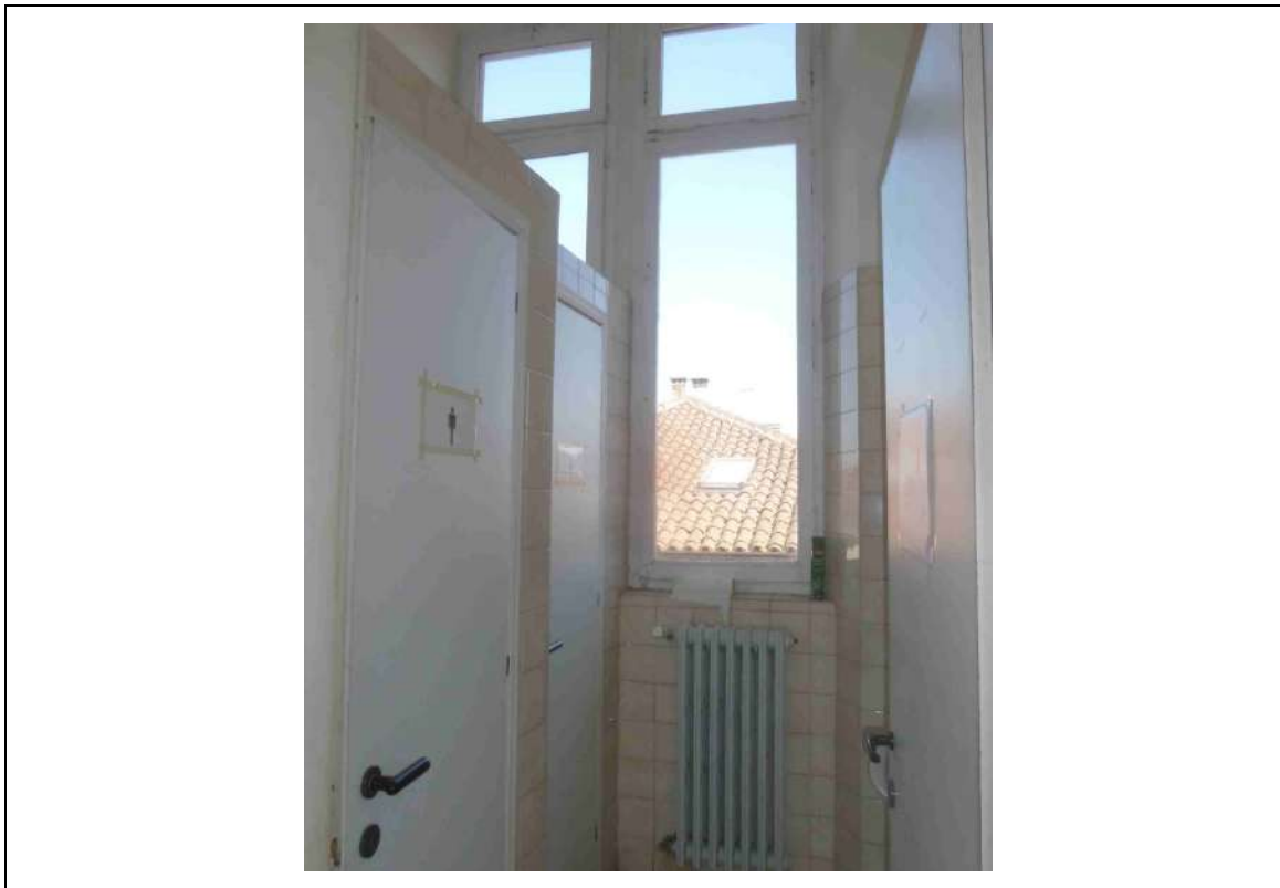
Foto 11 – Stato di fatto – Dettaglio interno serramenti bagni a piano primo