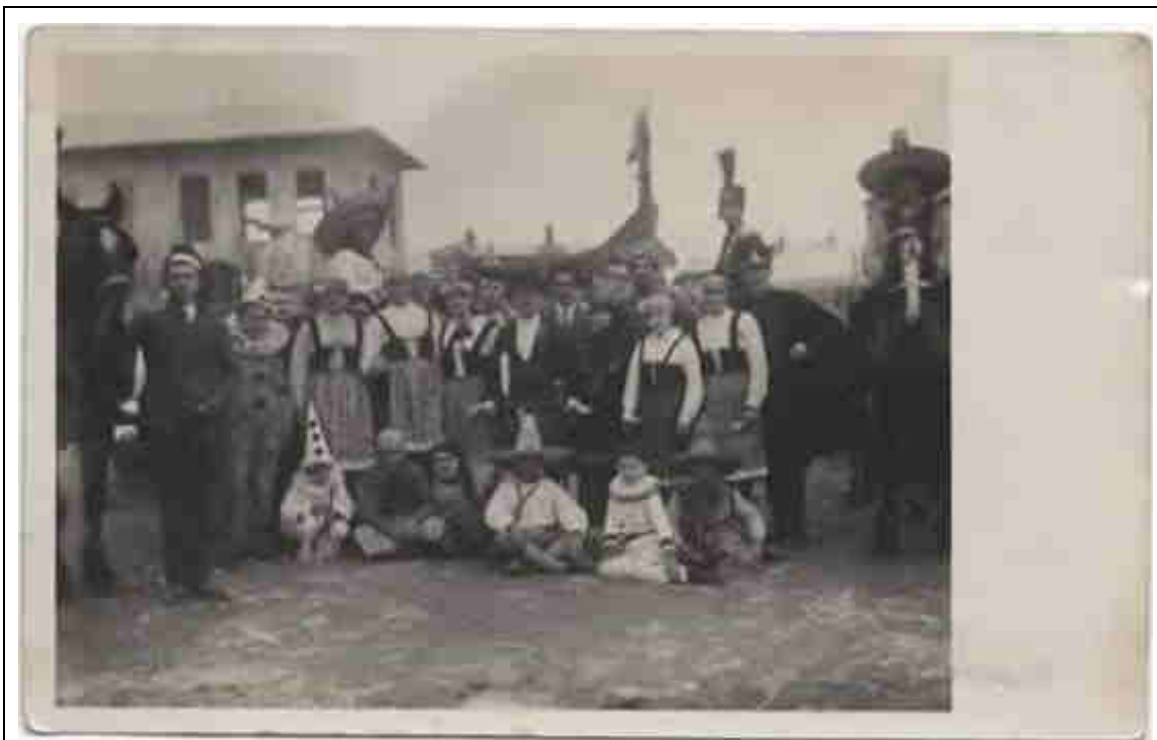
Foto 3 – Epoca, carnevale 1929 – Facciate lato sud-est e sud-ovest.