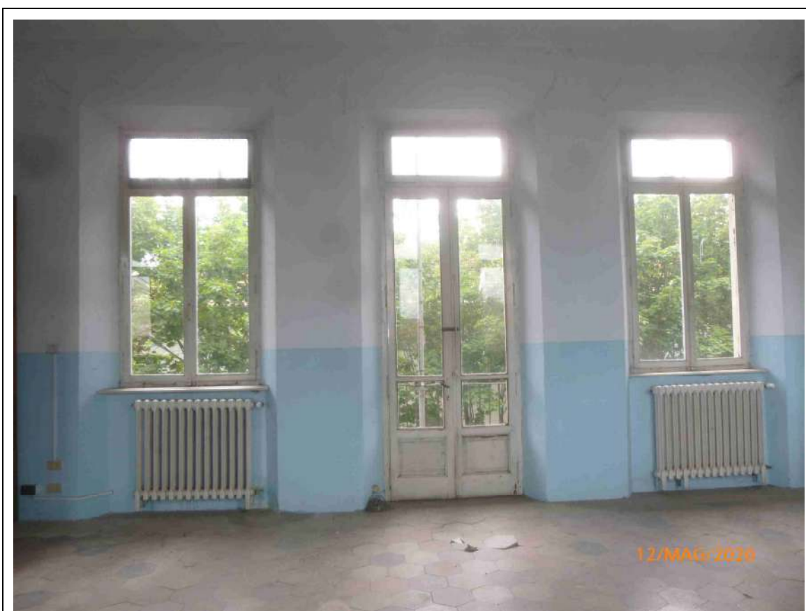
Foto 10 – Stato di fatto – Dettaglio interno serramenti a piano primo