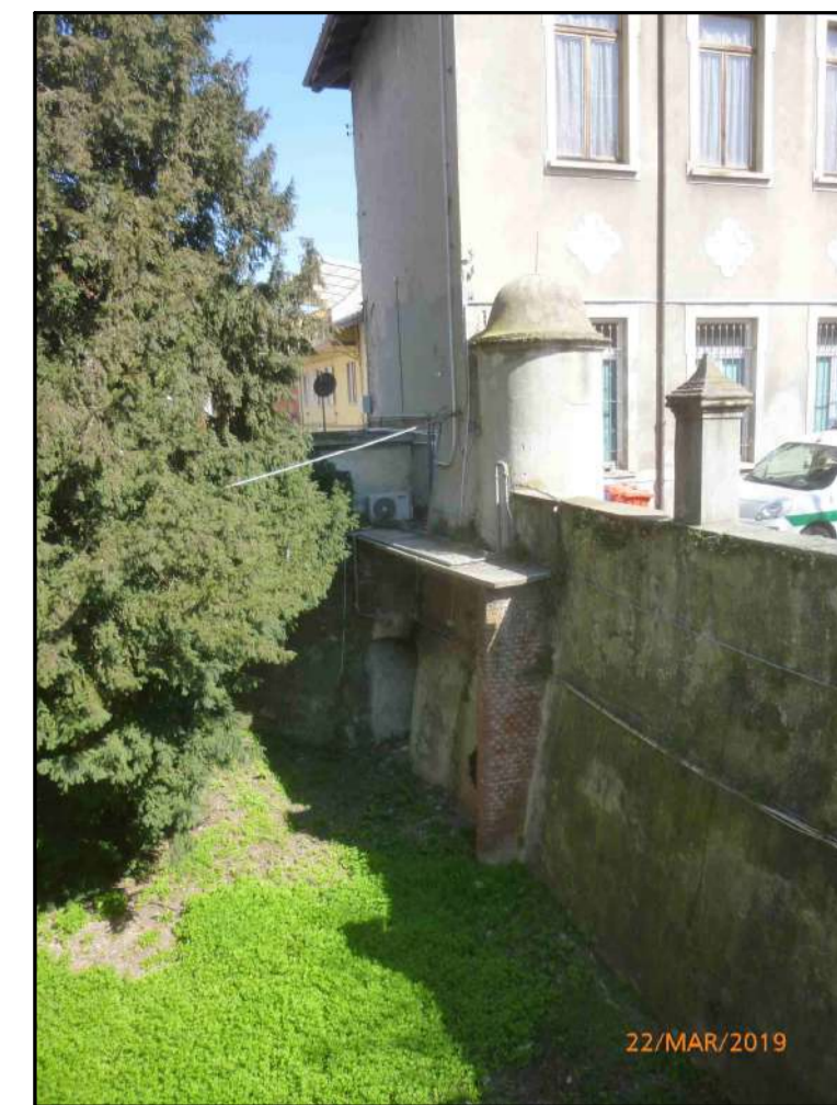
Prospetto lato fossato Sc. 1/50