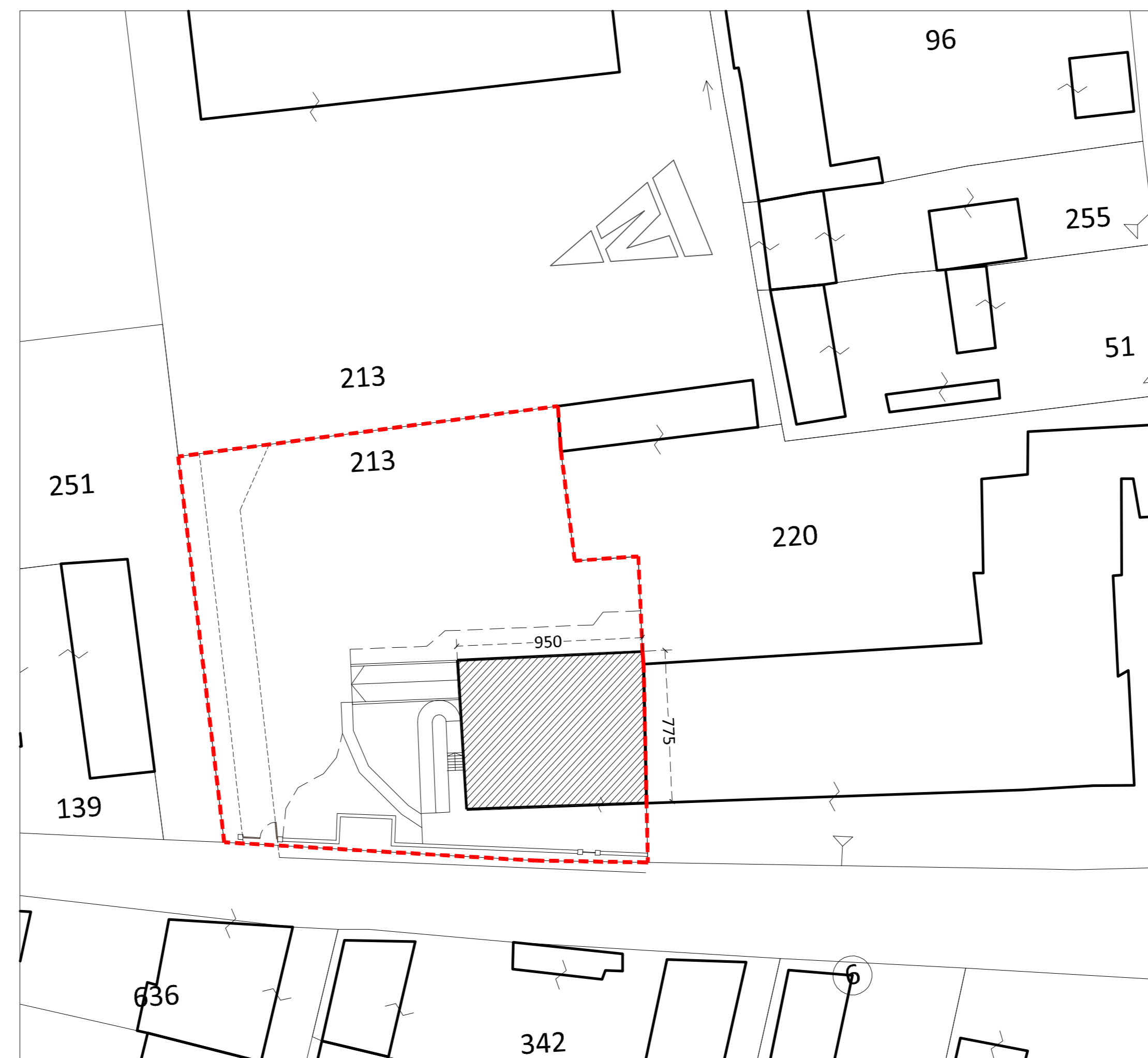
PLANIMETRIA - scala 1:200