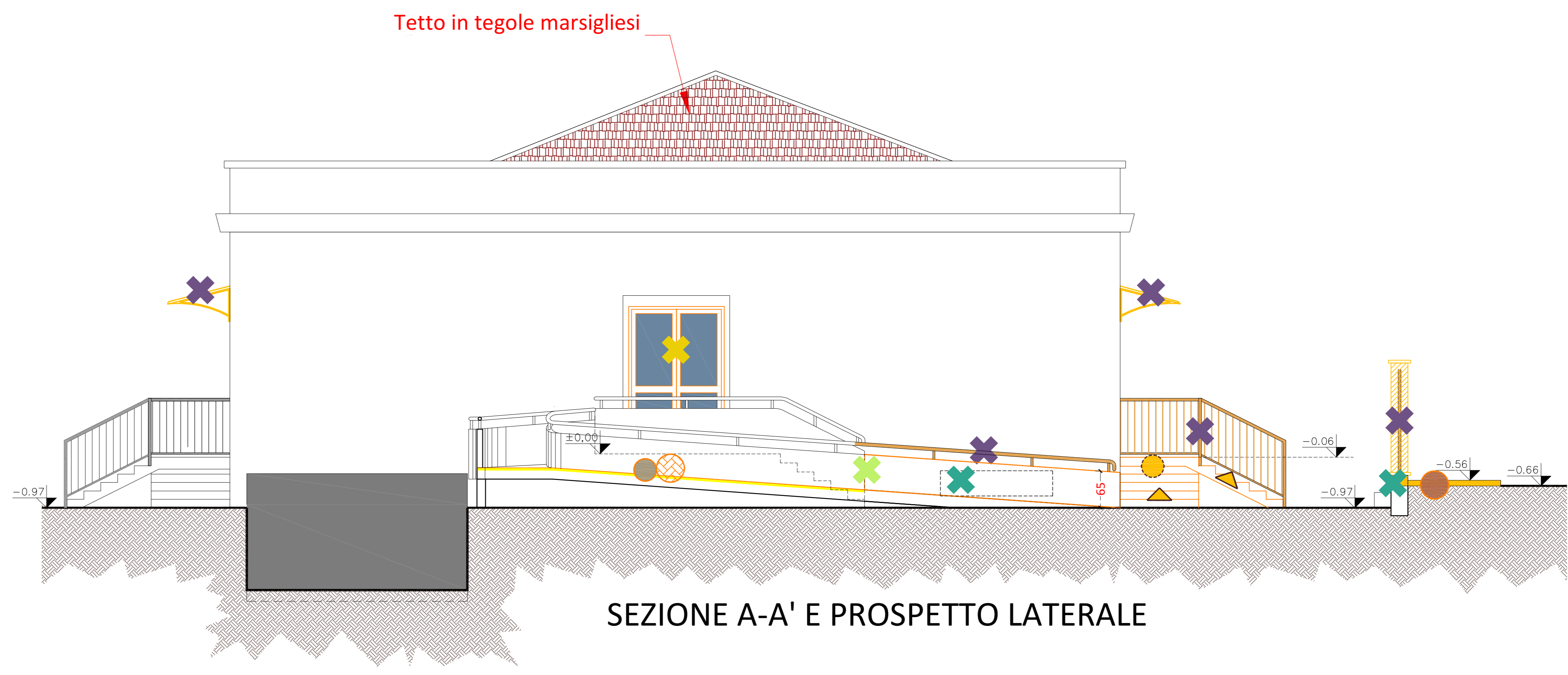
SEZIONE A-A' E PROSPETTO LATERALE