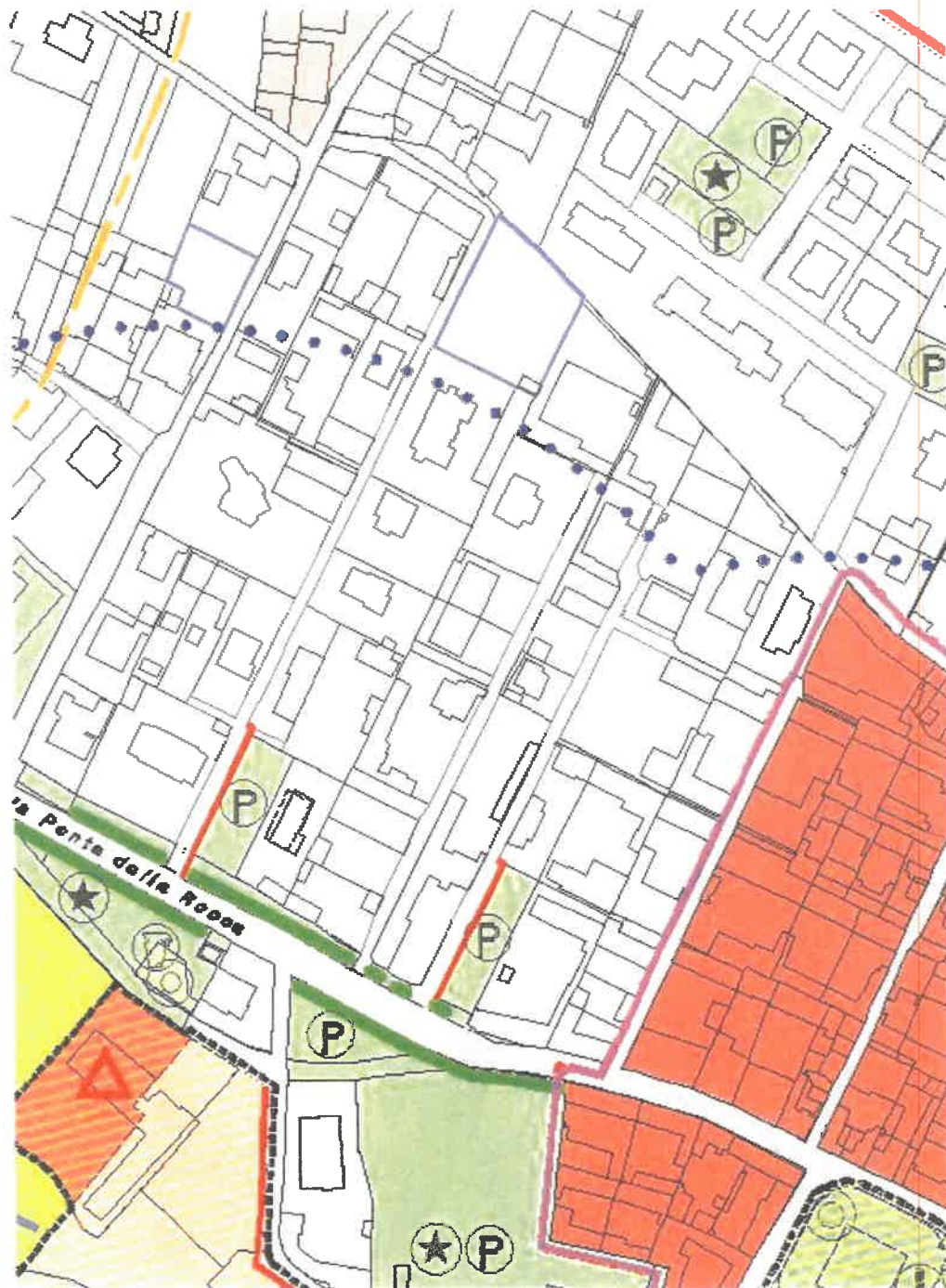
VIA PRIMO MAGGIO – VICOLO MONTEGRAPPA