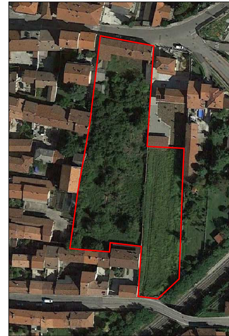
ORTOFOTO AREA DI INTERVENTO non in scala