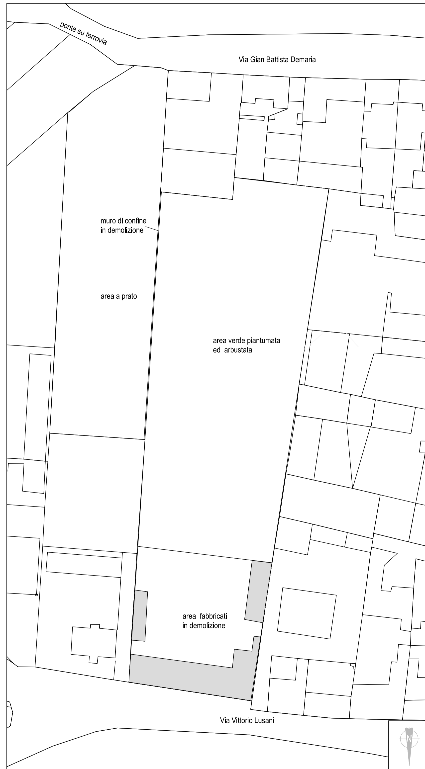
PLANIMETRIA GENERALE DELL'AREA IN STATO DI FATTO scala 1:500