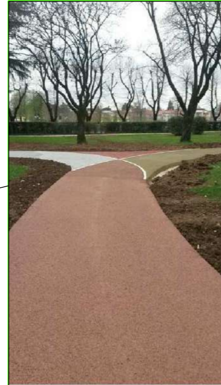
pavimentazione in calcestruzzo drenante

DOCUMENTAZIONE FOTOGRAFICA ESEMPLIFICATIVA