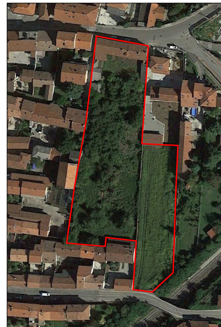
ORTOFOTO AREA DI INTERVENTO non in scala