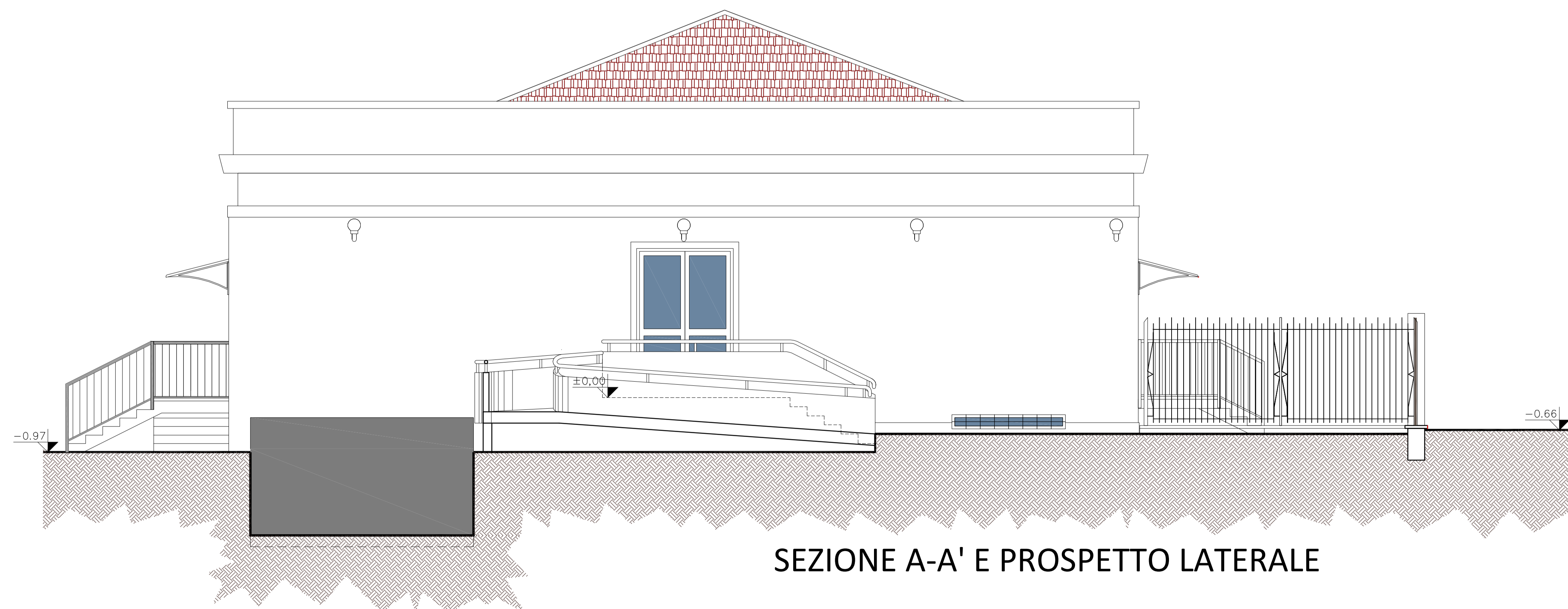
SEZIONE A-A' E PROSPETTO LATERALE