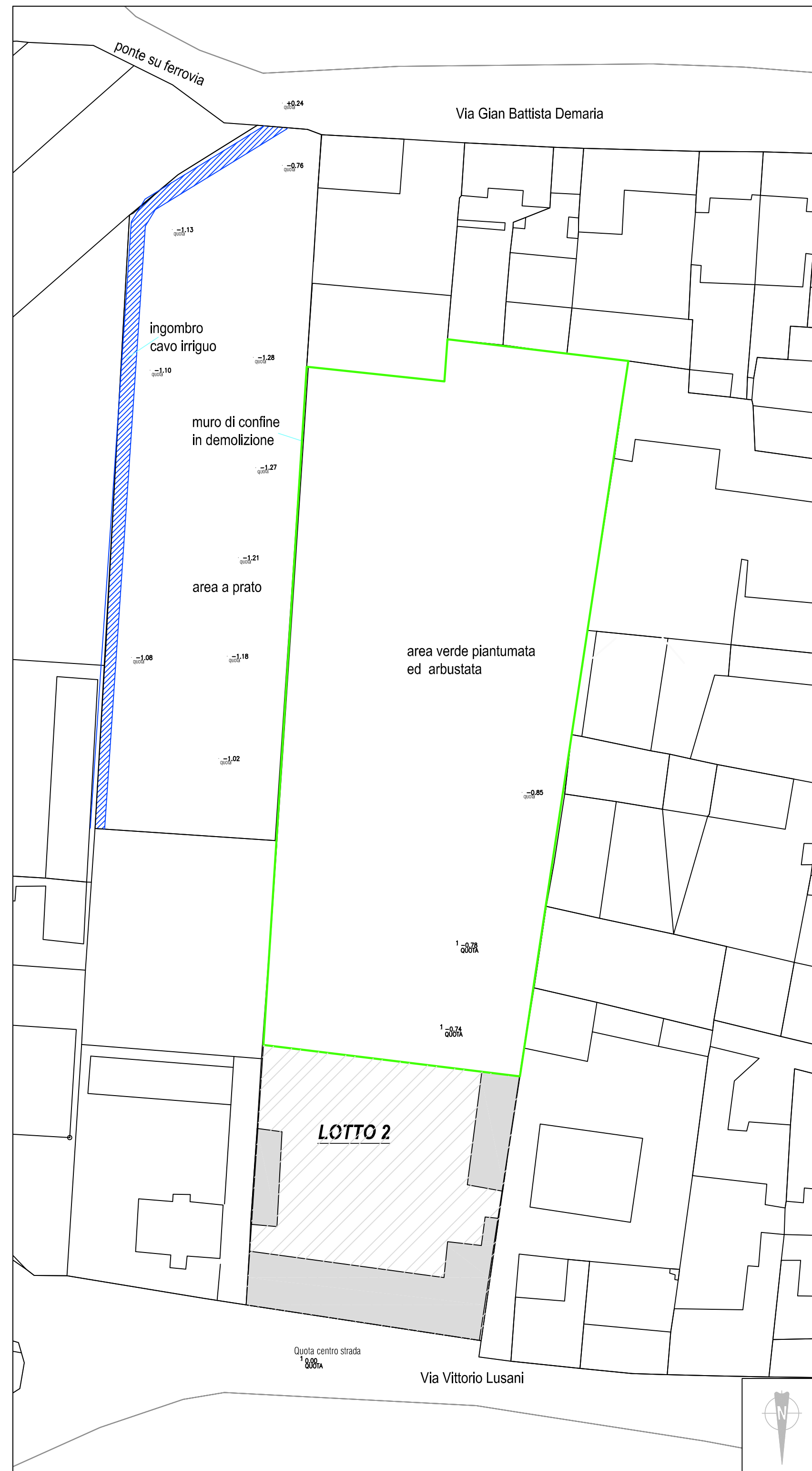
PLANIMETRIA GENERALE DELL'AREA IN STATO DI FATTO scala 1:500