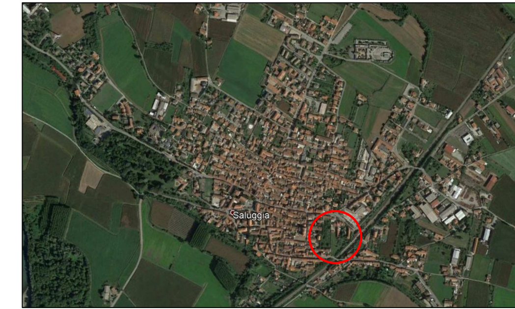
ORTORFOTO CENTRO ABITATO SALUGGIA non in scala