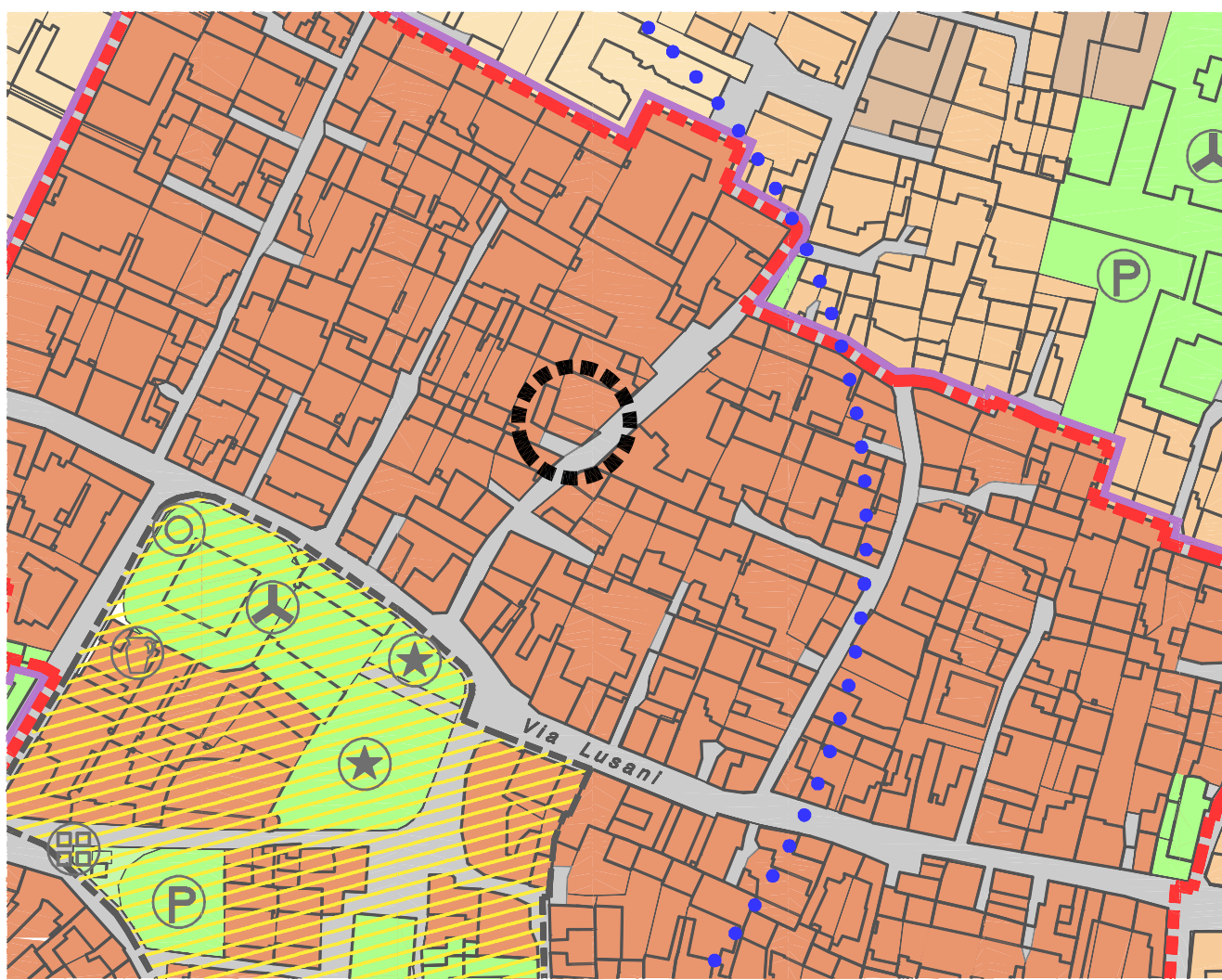
Estratto tavola Op1a del Progetto Preliminare di Variante Generale di P.R.G.C. - Scala 1:2.000