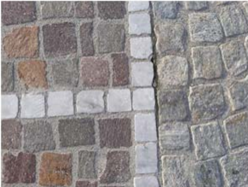
CUBETTI DI MARMO DI CARRARA

Materiali pavimentazione e particolari posa