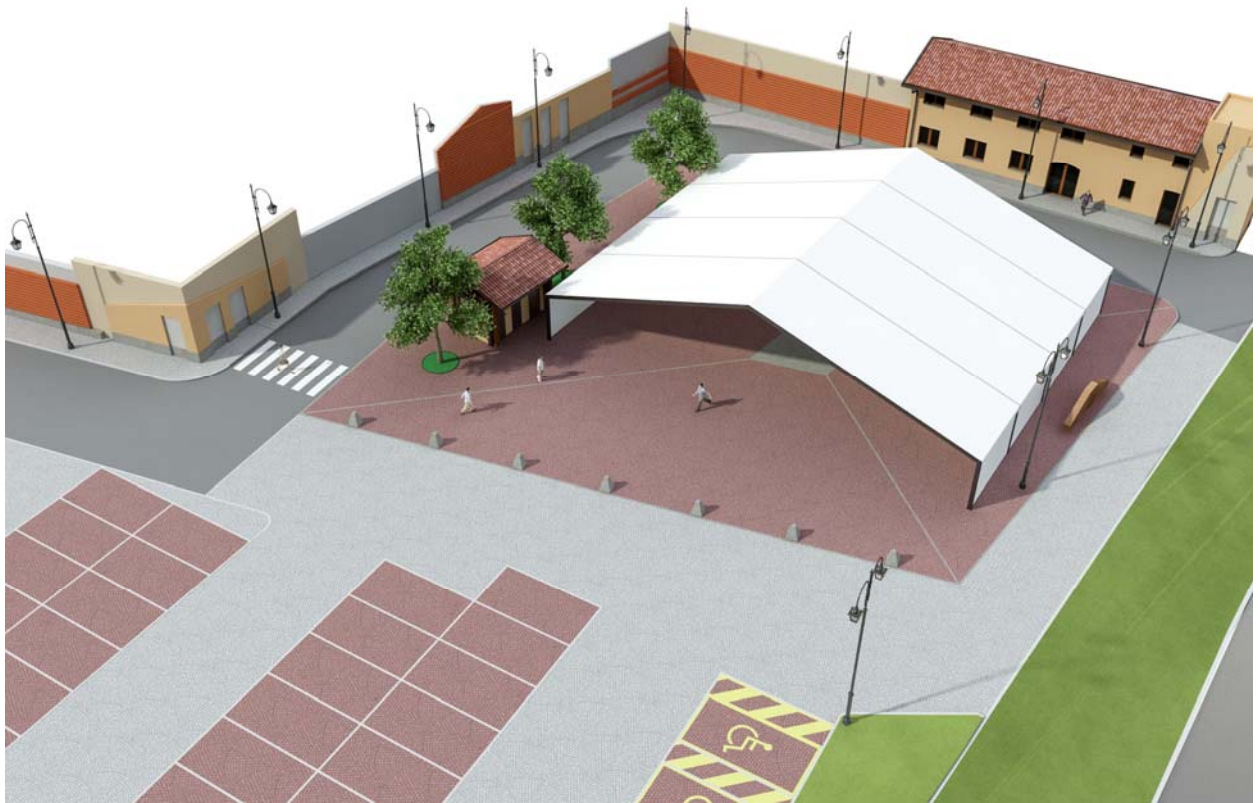
Render progetto variante con allestimento per eventi e spettacoli