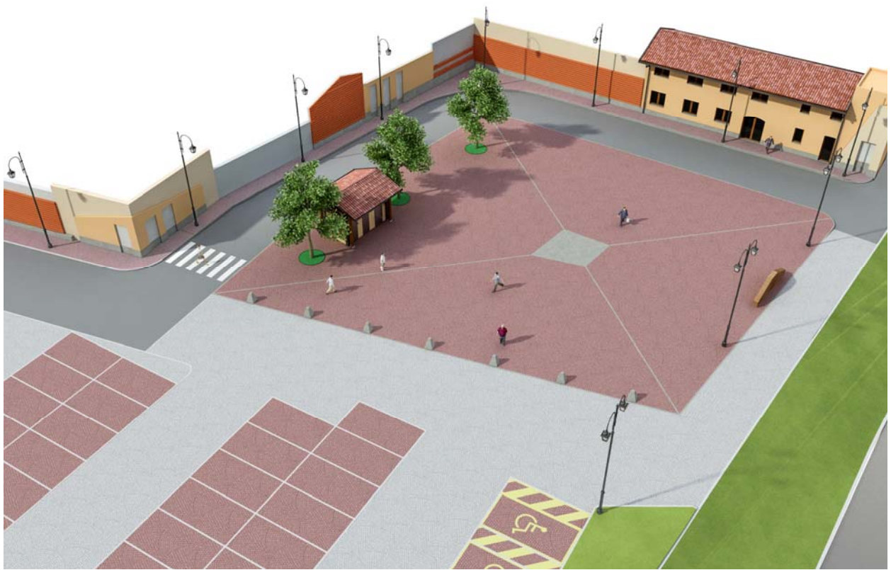
Render progetto variante