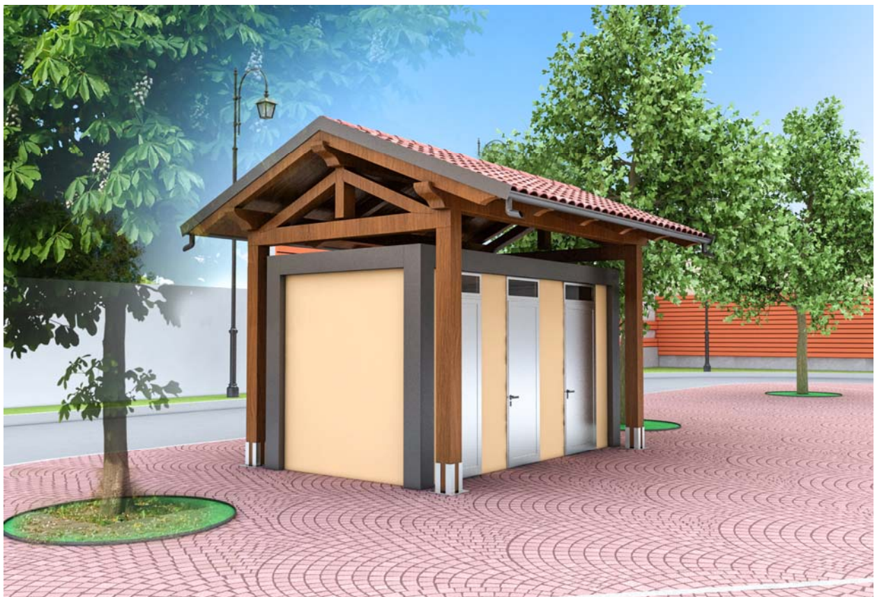
Bagno prefabbricato con copertura