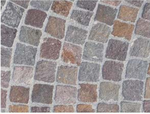
CUBETTI DI GRANITO ROSSO MANGA