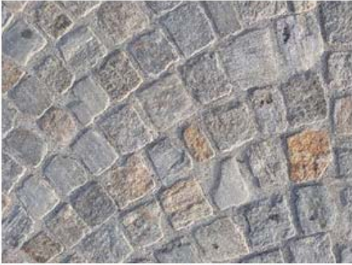
CUBETTI DI SIENITE