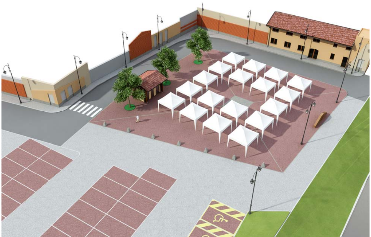
Render progetto variante con allestimento per mercatini