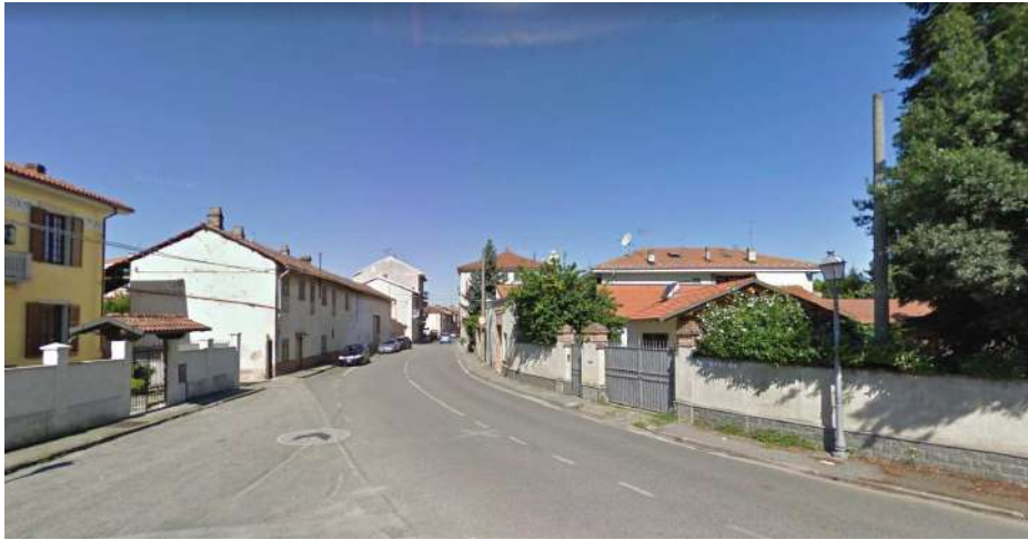
Ripresa Fotografica 1 – Largo Stazione Via Fiandesio