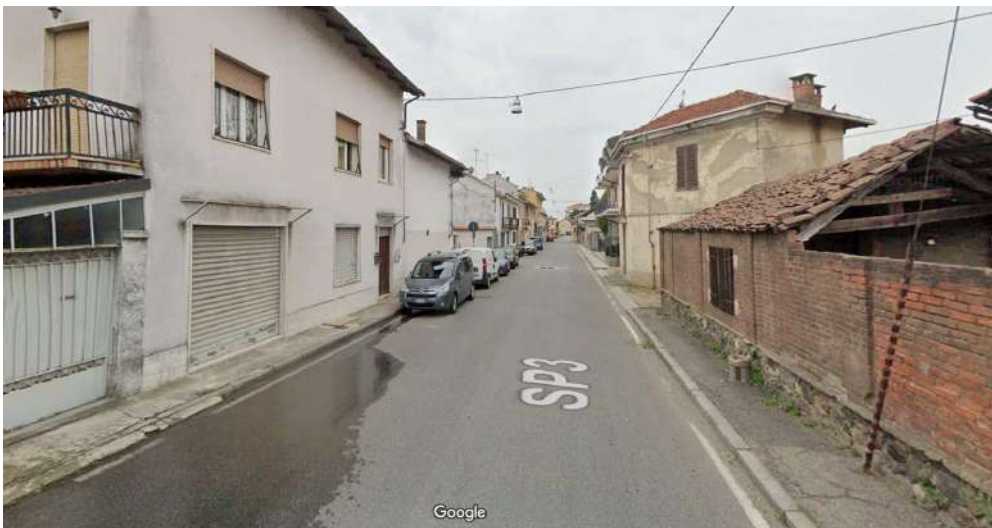
Ripresa Fotografica 2 e 3 – Via Fiandesio